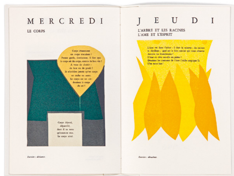
Livre - Manuel de dessin - réalisé en 2001 à 8 mains.